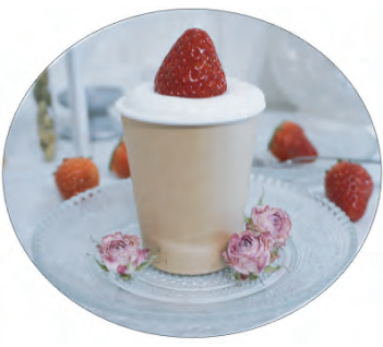
土日限定販売の「いちごのショートケーキ」530円。100%植物性なのに本物の生クリームのような濃厚さ。

札幌市出身。理系大学の物理学科を卒業後、大手IT広告代理店に就職。独立し、日本初のお菓子テックカンパニー(お菓子×ITテクノロジー)「株式会社TREASURE IN STOMACH」を立ち上げるとともに、'18年11月に「社会を考えたお菓子屋さん issue sweets lab」を中央区円山に開業。