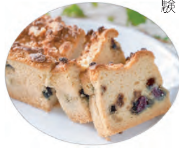
無農薬ブルーベリーを使用した「ブルーベリーのクランブルケーキ」450円。クランブルのザクザク感とブルーベリーの甘酸っぱさが特徴。

円山の住宅街にひっそりと佇む小さな一軒家。「issue (イシュー)」と書かれた小さな看板を頼りに扉を開けると、焼き菓子の甘い香りがふんわりと漂います。棚の上にはマドレーヌやフィナンシエ、パウンドケーキなどの美味しそうなお菓子がずらり。一見すると普通の菓子屋さんにも見えますが、こちらで製造・販売するお菓子は全て、卵・小麦粉・乳製品・白砂糖を含まず、動物性食材は一切使っていないのも関わらず、見た目や美味しさはそのままと同じ魔法のようなお菓子を提供しています。