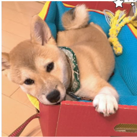
しっぽ (オス 5ヶ月)