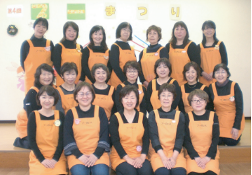
↑『プーのいえ』メンバーの皆さん。現在新規メンバーを募集中！

「プーのいえ」は、利用者のお宅に伺って子どものお世話をする「個人保育」と、企業の講演会やイベントなどに保育者が出向き、子どもたちの保育をする「集団保育」の「ルーム保育」があります。お母さんの気分転換やちょっとした用足しなど、子どもを預ける理由はどんなことでもOK。登録当日でも利用ができます。また、出前遊び「えがお」では、わらべうたや昔遊び、身近なものを使った遊び、お店屋さんごっこなどの楽しい遊びを提供しています。