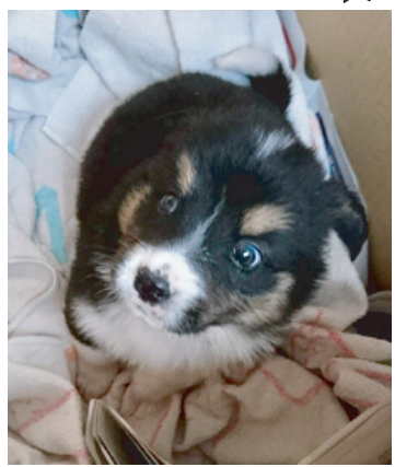
ベルナルド (オス 2ヶ月)